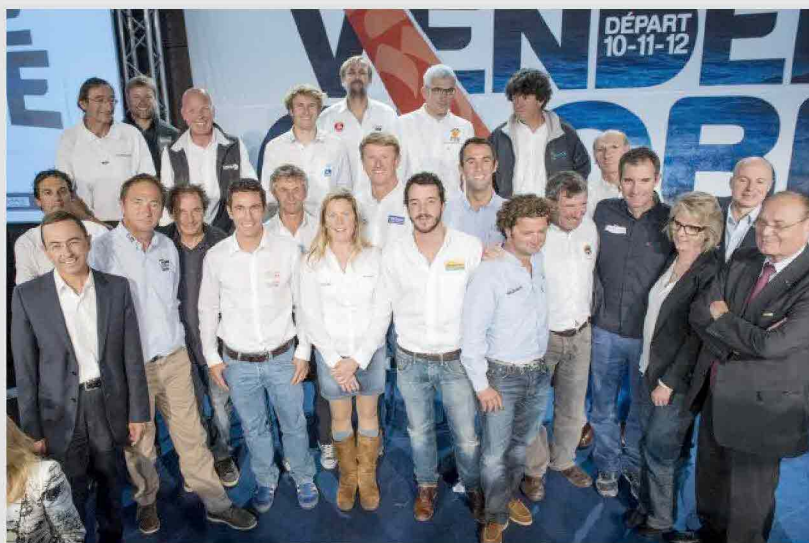
Gli skipper del Vendee Globe alla presentazione di ieri a Parigi