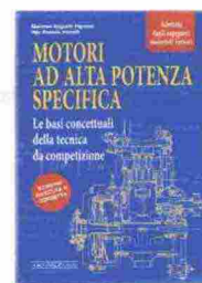
MOTORI AD ALTA POTENZA SPECIFICA Giacomo A. Pignone e Ugo Romolo Vercelli Giorgio Nada Editore 576 pagine € 39

a Monza, in seguito a un incidente appena dopo il via del Gran Premio d'Italia del 1978. Il volume, parte della collana "Uomini e Sogni", raccoglie circa 50 testimonianze di persone che hanno condiviso momenti con lui.