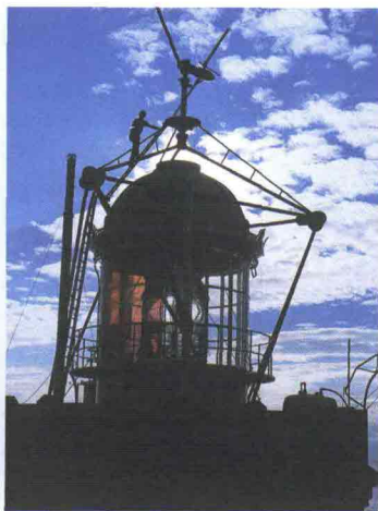
Fotografie con copyright mai stato trasferito come la paternità di Philippe Petit. L'ultimo è un'immagine di un faro in costruzione, di Parigi, probabilmente la più grande l'illuminazione di una singola torretta di cemento nelle rovine di New York, dopo all'incendio di Bunker. Il lavoro iniziato nel 1902 che il progetto di costruzione iniziò nel 1918 fu seguito alla consegna di un'opera di Lohde. Per ringraziare le guardie del faro della Guardia, i nomi delle guardie vennero messi su base della torre. I nomi di costruzione, con il titolo della Guardia vennero venuti nel 1918.

S ferzato da onde violente, risucchiato da correnti e da vortici, spesso aggrappato a uno scoglio e solo, in mezzo a un mare che è chiamato a sorvegliare e che lo scuote e lo flagella, il faro è uno dei luoghi più affascinanti che esistano, di una bellezza vertiginosa e attraente, capace di incutere rispetto e timore. Questo libro, firmato dal più grande fotografo di fari di ogni tempo, racconta la loro storia, dal 1800 - quando fiorì (soprattutto in Francia) la costruzione delle 'sentinelle del mare' con i più grandi architetti dell'epoca - fino ai giorni nostri , che vedono la quasi totale automatizzazione delle 'lanterne'. Ma il volume di grande formato narra anche le storie (vere) degli uomini che prima li hanno costruiti (spesso in maniera rocambolesca e ardita) poi 'sorvegliati' e infine abbandonati , delle barche che grazie ai loro segnali si sono salvate, di calme e di tempeste. A metà strada tra il documento e l'opera d'arte , questo magnifico libro è un omaggio alla carriera dell'autore e all'irripetibile storia dei fari della Francia e del mondo. Emozionante. Fari , Jean Guichard, euro 29,90 Ippocampo Edizioni.